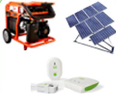
ACCESORIOS PARA TU KIT SOLAR